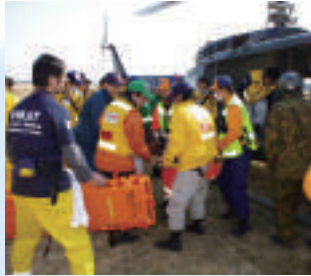
北九州総合病院のDMAT（災害派遣医療チーム）、熊本地震や東日本大震災で活動を行いました。

地域の救急医療機関として、高度な医療技術と最新システムで24時間診療にあたっています。また専門性を追求するべく「センター化」へ取り組み、診療科の特化に取り組んでいます。