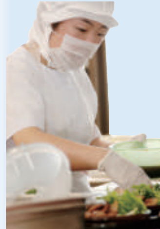
北進産業株式会社より提供された食材が、あらゆる施設で利用されています。

安全管理はもちろんのこと、早期治療を実現するために新鮮で安心・安全な食事を提供しています。