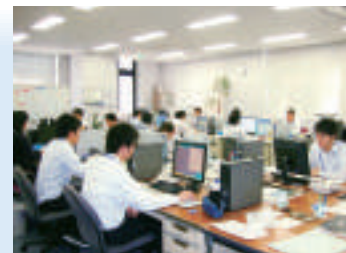
システム部門や管財部門などにより、万全の管理体制を敷いています。

グループの運営をスムーズに行えるよう環境を整えるとともに、迅速・丁寧を心がけ患者さまへのサービスにつなげています。