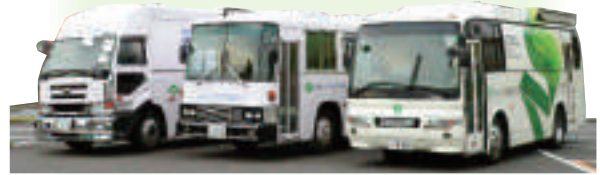
職場に健診車を派遣し健康診断を行っています。

地域のみなさま、また地域の企業で働いているみなさまの健康づくりと病気予防のために、定期健診から生活習慣病予防健診・人間ドックの実施のほか、産業医活動など広範囲にわたって活動しています。