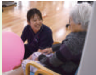
回復期リハビリテーションや排泄管理の指導などを積極的に行っています。

療養やリハビリテーションが必要な患者さまの受け入れを積極的に行い、各病院の特徴を活かしながら、患者さまにあった治療を実践しています。