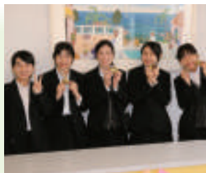
学校祭での様子。学習の成果を発揮します。

看護の理論と実践を通して、専門職業人としての看護観を育てるとともに、すぐれた知識・技術を習得し医療現場を支える看護師養成に力を注いでいます。