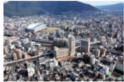
北九州中央病院上空から